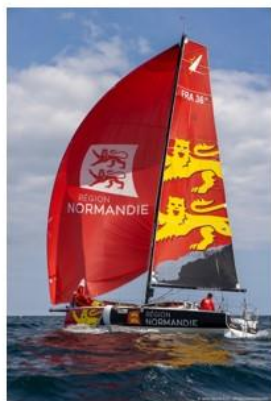
Le drapeau séparé de la Normandie sur le bateau du Conseil régional. L'ÉTO

PARIS SOCIÉTÉ FRANÇAISE D'HÉRALDIQUE ET DE SIGILLOGRAPHIE EDITIONS DU LEOPARD D'OR 2024