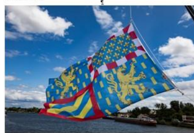
Drapeau aux armes de la région Bourgogne-Franche-Comté (créateur René Machin), officialisé en 2017

Avec les contributions de : Jean-Baptiste AUZEL, Marc BARONNET-STEINBRECHER, Arnaud BAUDIN, Clément BLANC-RIEHL, Jean-Luc CHASSEL, Céline CROS, Hyacinthe DESJARS DE KERANROUË, Abbé Bruno GERTHOUX, Lieutenant-Colonel Marcel JOUSSEN-ANGLADE, Lily MARTINET, Pierre MOLLIER, François PERNOT, Fulcran de ROQUEFEUIL, Caroline SIMONET, Nicolas VERNOT